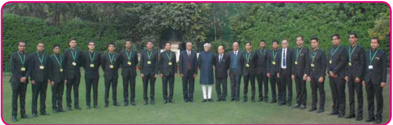
माननीय उप राष्ट्रपति श्री एम. हामिद अंसारी के साथ भारतीय दूरसंचार सेवा के 2014 बैच के प्रशिक्षार्थी अधिकारी