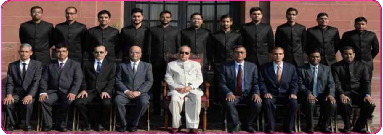
माननीय राष्ट्रपति श्री प्रणब मुखर्जी के साथ भारतीय दूरसंचार सेवा के 2014 बैच के प्रशिक्षार्थी अधिकारी

अधिकारियों को संबोधित करते हुए कहा कि उनके पास अधिकारियों के लिए एक संदेश है जो आने वाले सालों में उनके विचारों और कार्यों में मार्गदर्शन करता रहेगा। किसी और विषयवस्तु से ज्यादा तीन आई, जो कि ईमानदारी (इंटेग्रिटी), नवप्रवर्तन (इनोवेशन) और भारत (इंडिया) हैं, उनके विचारों और कार्यों का मूल आधार होना चाहिए। यह अत्यंत महत्वपूर्ण है कि उनके उद्देश्यों में सत्यनिष्ठा, कार्यों में नवीनता और उनके द्वारा किए जाने वाले प्रत्येक कार्य और सौंपे गये हर दायित्वों के निर्वाहन के मूल में भारत का हित होना चाहिए। राष्ट्रपति महोदय ने युवा प्रशिक्षार्थी अधिकारियों को सूचना एवं संचार प्रौद्योगिकी का इस्तेमाल भारत के लोगों को सेवा प्रदान करने की प्रक्रिया में सुधार एवं विस्तार के लिए करने को कहा।